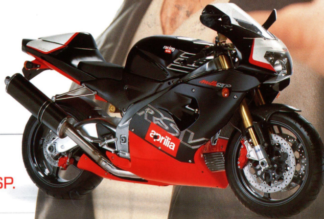
RSV mille SP