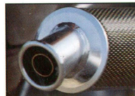
Sportlichkeit zeigt sich von ihrer besten Seite