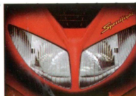
Ein ausdrucksstarkes Gesicht auf der Straße

Spritzig, lässig, cool, chic, stark, wendig, rassig, trendig, locker, abgefahren, Spitze!